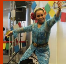
昨年のワン・ワールド・フェスタの様子です。